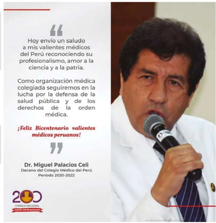
Imagen 37. Saludo a la orden médica nacional del doctor Miguel Palacios Celi, decano nacional del Colegio Médico del Perú, con motivo del bicentenario de la independencia nacional (28 de julio de 2021)