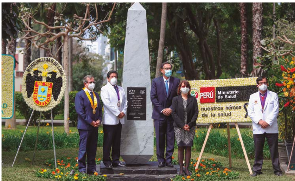
Imagen 31. Inauguración del obelisco en homenaje a los héroes de bata blanca que ofrendaron su vida durante esta pandemia. Parque Domodossola, Miraflores, Lima (13 de agosto de 2020)