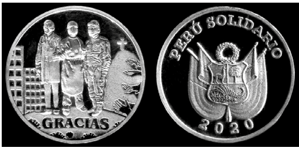
Imagen 38. Anverso y reverso de la medalla en homenaje a los héroes peruanos durante la pandemia por el COVID-19. Fabricada por La Casa de la Medalla, Lima (2020)

Hasta aquí llega el relato de la administración encabezada por el doctor Miguel Palacios Celi, decano Nacional del CMP, que debió enfrentar la terrible pandemia del COVID-19, bajo el lema ¡Gestión humanista, solidaria y luchadora!