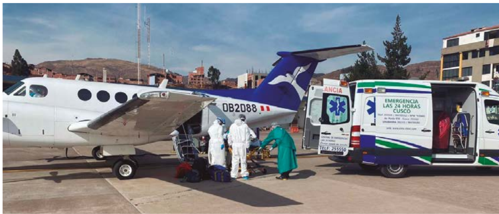
Imagen 29. Traslado por vía aérea a la ciudad de Lima de los médicos que residían en el resto del territorio nacional y que se hallaban gravemente enfermos por el COVID-19

lacrimógenas. Al tomar conocimiento de este hecho, el ministro Zevallos se reunió con los facultativos, les expresó su solidaridad y acordaron reunirse en el primer día útil del mes de julio.