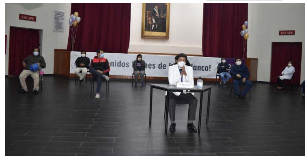
Imagen 28. Homenaje del doctor Miguel Palacios Celi, decano nacional del Colegio Médico del Perú, a diez médicos peruanos, héroes de bata blanca, que sobrevivieron al COVID-19. Auditorio Pedro Weiss del Colegio Médico del Perú, Miraflores, Lima (26 de mayo de 2020)

hallaban en primera línea luchando contra el nuevo Coronavirus, y manifestó “sabemos que hay problemas y necesidades aun insatisfechas. Haremos todo nuestro esfuerzo para ir corrigiendo las deficiencias y así dar las condiciones mínimas e indispensables para el correcto desempeño de sus funciones” .