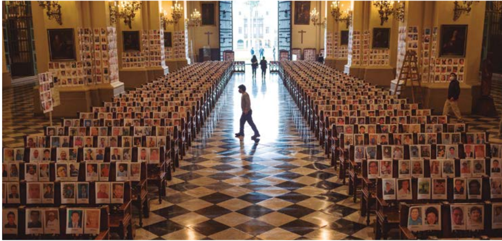
Imagen 30. Homenaje a los fallecidos por el COVID-19 en la catedral de Lima (15 de junio de 2020)