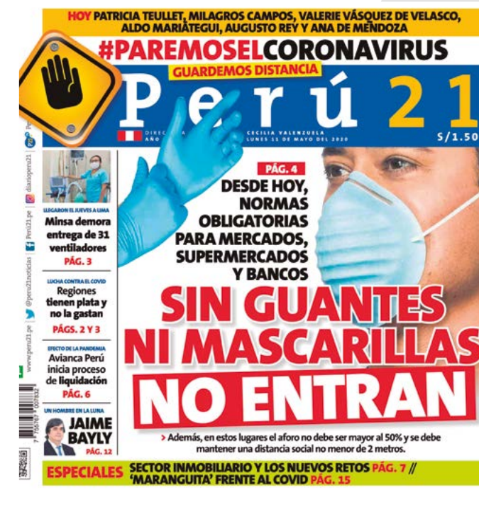
Imagen 27. Caratula del diario Perú 21 donde se señala la carencia de equipos de protección personal durante la pandemia por el COVID-19 (11 de mayo de 2020)