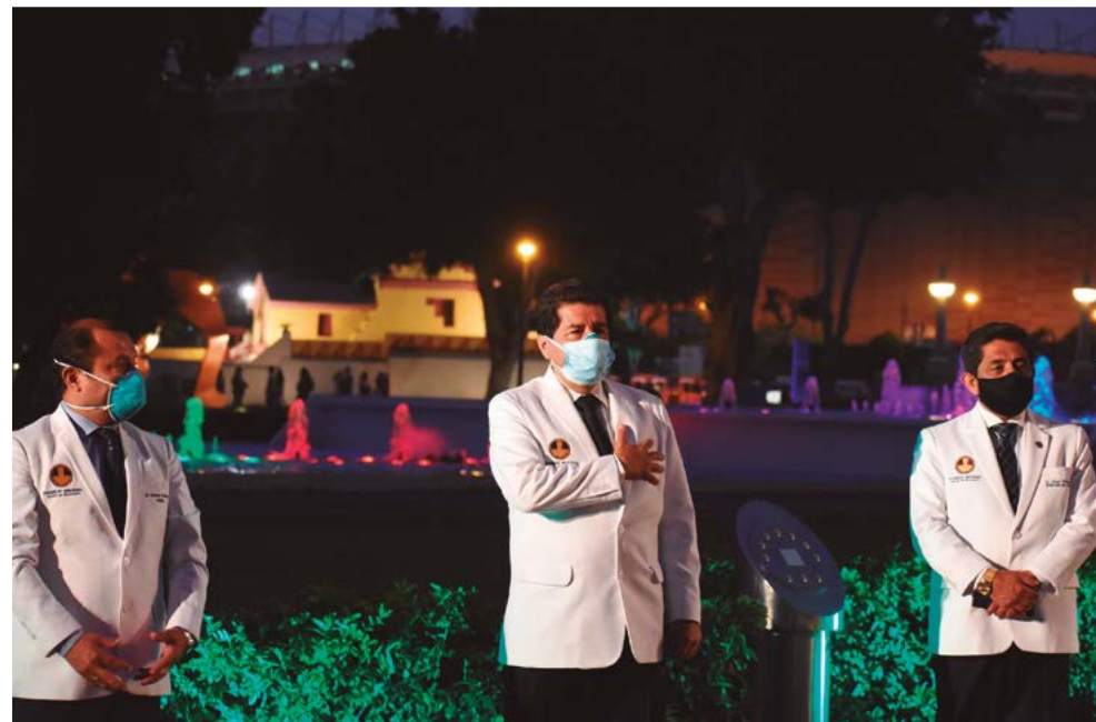
Imagen 34. Ceremonia conmemorativa al primer año del fallecimiento del primer médico peruano víctima del COVID. Parque de las Aguas, Lima (8 de abril de 2021)

El CMP, mediante el Comunicado N° 123, informaba a la comunidad médica nacional que hasta ese momento no existía evidencia científica sobre la adecuada estandarización de los resultados de los anticuerpos neutralizantes efectuados en los laboratorios clínicos nacionales, como medio para establecer si las personas vacunadas estaban realmente inmunizadas.