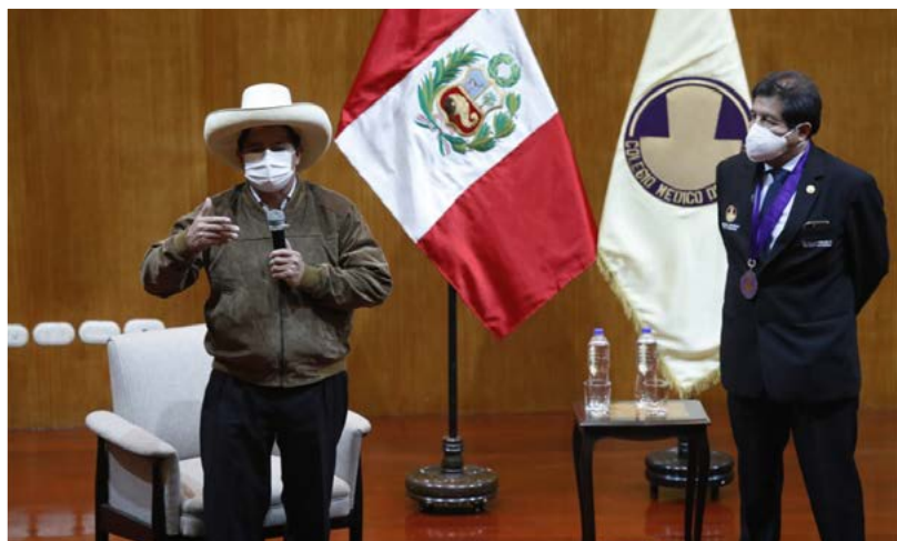
Imagen 35. Reunión entre el doctor Miguel Palacios Celi, decano nacional del Colegio Médico del Perú, y Pedro Castillo Terrones, luego proclamado presidente de la República, Colegio Médico del Perú, Miraflores, Lima (3 de julio de 2021)

Finalmente el 7 de agosto, el Congreso de la República aprobó la ley que modificaba los artículos 121 y 122 del código penal; el CMP saludaba esta importante aprobación de la ley N° 31333, promulgada mediante el decreto legislativo N° 635.