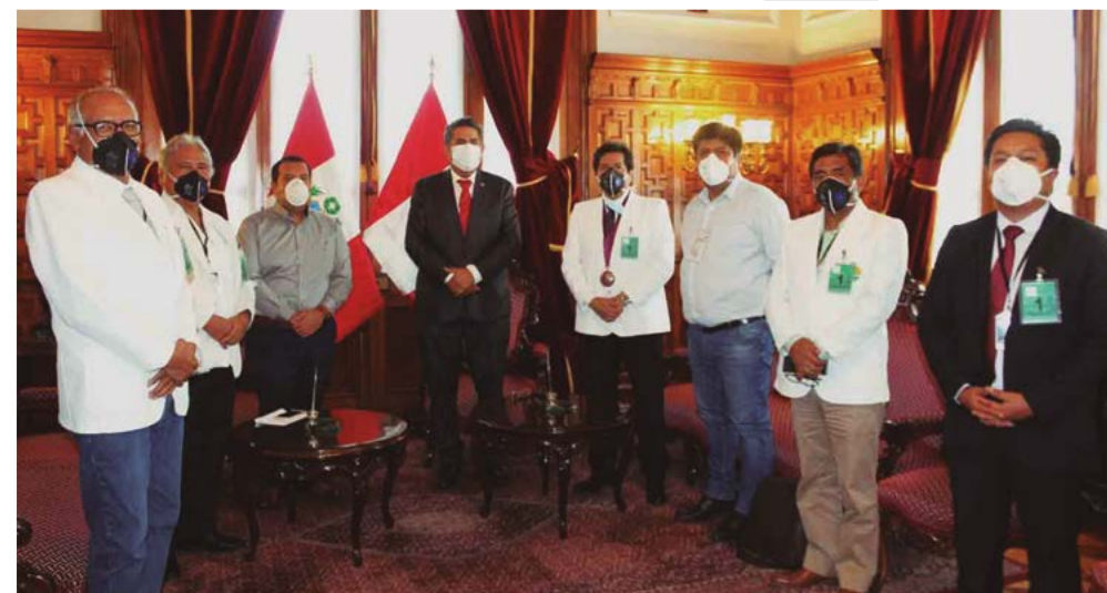
Imagen 26. El consejo nacional del Colegio Médico del Perú concurría al Congreso de la República para presentar cuatro proyectos de ley en favor de los galenos en la primera línea de batalla (7 de abril de 2020)

El Congreso de la República aprobaría, el viernes 5 de junio, la ley N° 4453 que regula los procesos de ascenso automático en el escalafón, el cambio de grupo ocupacional, cambio de línea de carrera, el nombramiento y cambio a plazo indeterminado de los profesionales, técnicos, auxiliares asistenciales y personal administrativo de la salud, haciendo eco de las propuestas que había efectuado el CMP.