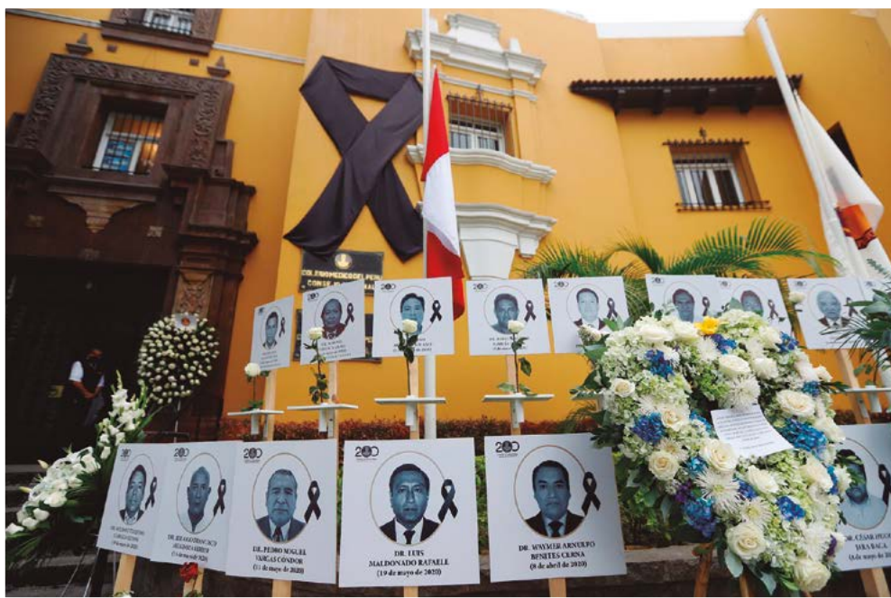
Imagen 33. Fotografías de los médicos peruanos fallecidos por el COVID-19, ante el frontis de la sede del consejo nacional del Colegio Médico del Perú. Miraflores, Lima (diciembre de 2020)