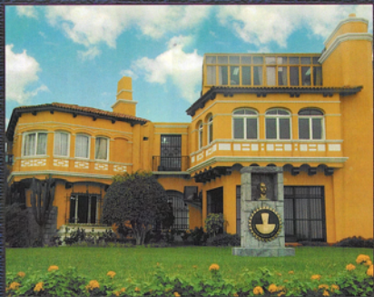
SEDE DEL COLEGIO MEDICO DEL PERU MIRAFLORES - LIMA - PERU